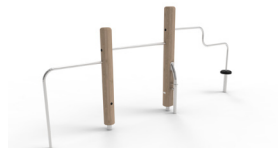
SAULTY - TRIO 0301-010-002