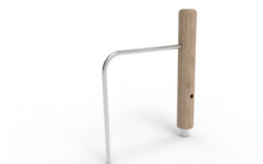
SAULTY - SINGLE 0301-001-002