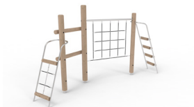
CLIMBY 4 0302-004-002