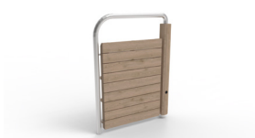
WALLY 1 0306-001-002