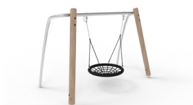
SWINDY 3 0305-006-002