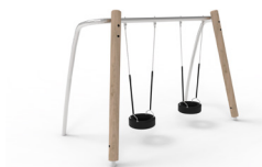
SWINDY 1 0305-004-002