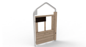
WALLY 2 0306-002-002