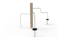
SUALTY - TRIPOD 0301-011-002