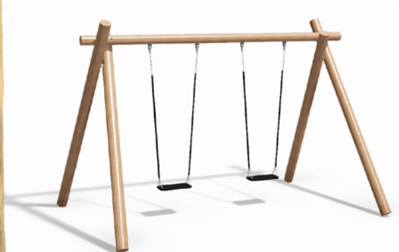
NORNA PLAYGROUNDS Columpio de acacia robinia LE20201