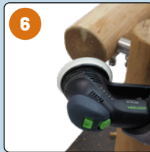
Zugesägte Holzkeile abschleifen