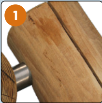
Riss im Holz