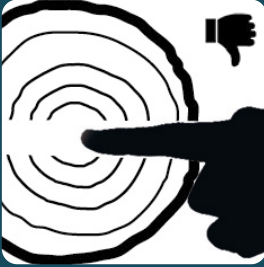
Durchgehende Spalte zwischen 8 mm und 25 mm.