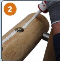
Mit Leim füllen